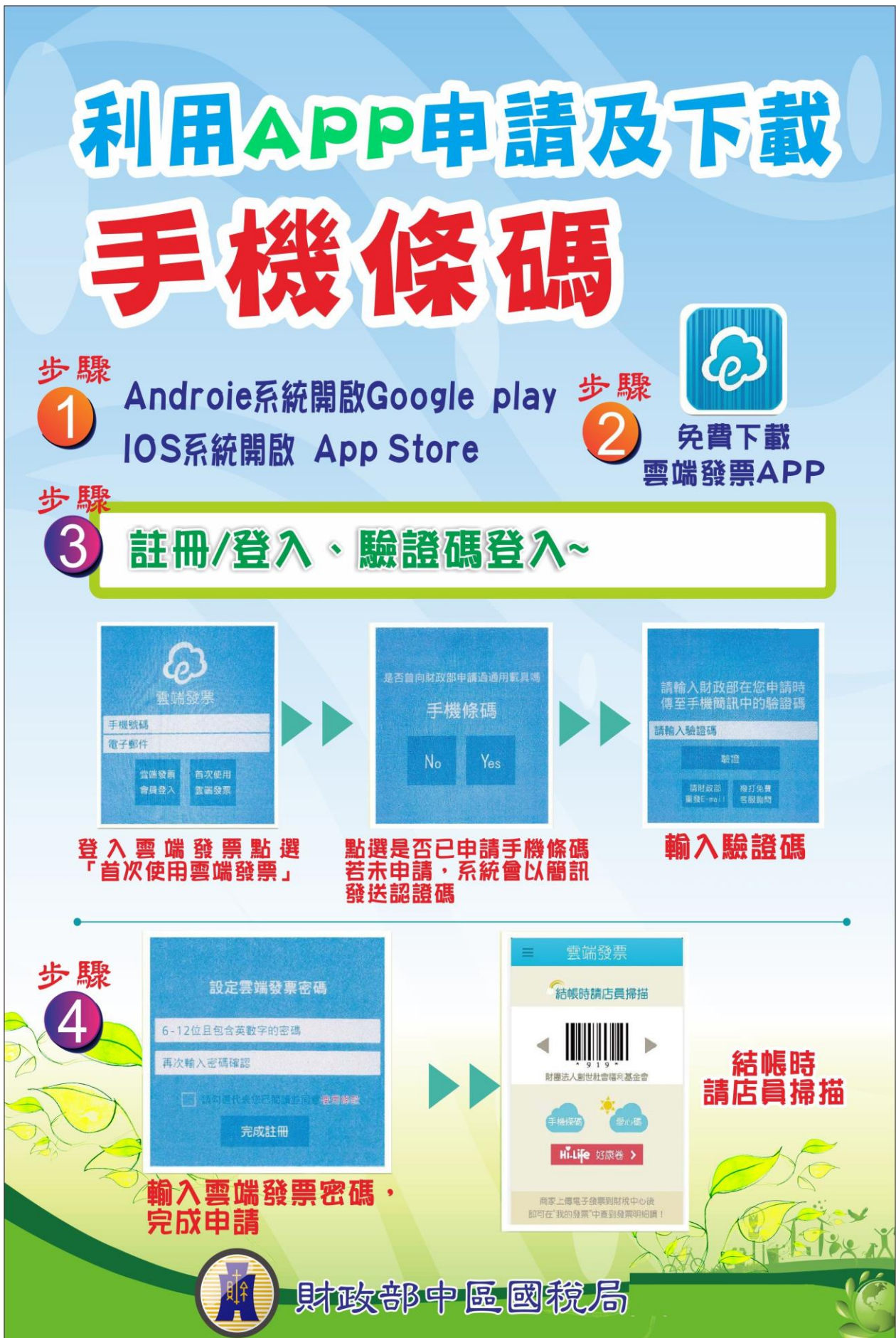
圖 2：雲端發票 APP