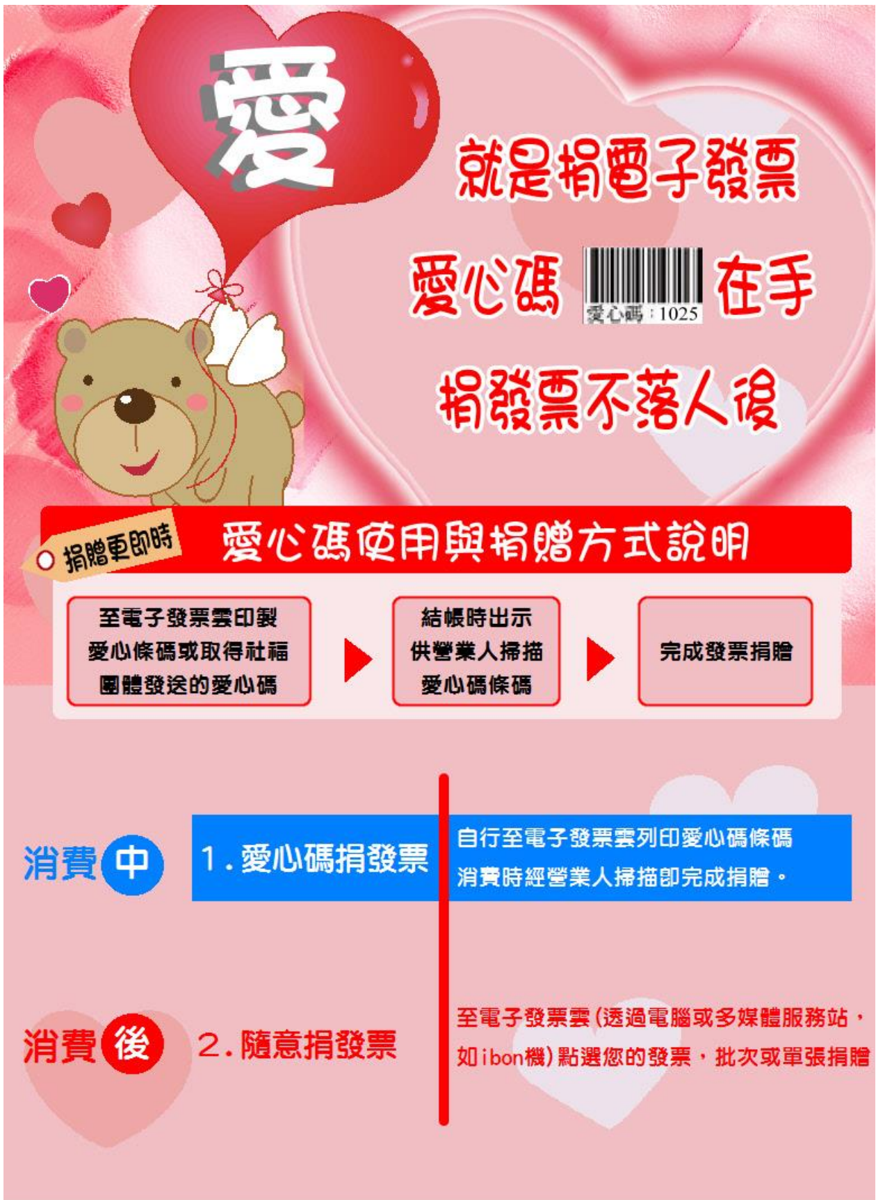
圖 4：愛心碼捐贈流程