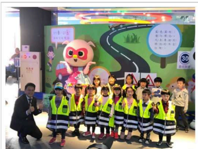
交通局長葉昭甫出席中市首座兒童交通安全教育館啟用典禮

社團法人中華車會與麗寶國際賽車場合作打造台中第一座「兒童交通安全教育館」，引進歐盟認證的兒童小汽車，透過實際體驗幫助兒童認識道路安全知識，今(13)日市府交通局長葉昭甫出席啟用典禮，肯定中華車會與麗寶國際賽車場用心規劃，寓教於樂提升兒童交通風險感知能力，與市府一同守護兒童安全。