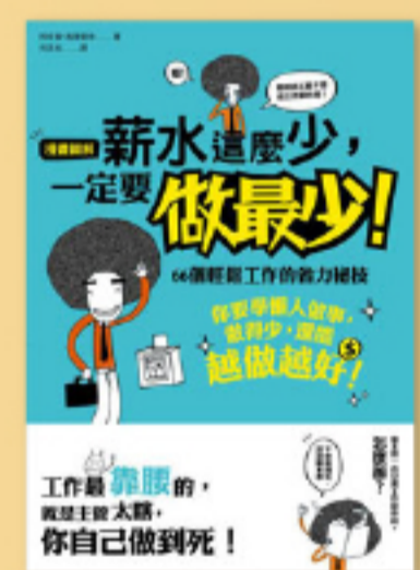
效率工作 工作力就是賺錢力