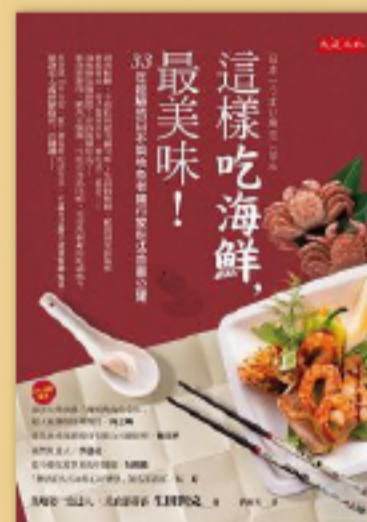
理想生活 快樂生活也是富足