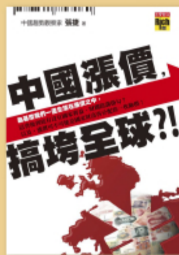
經濟趨勢 世界大事如何影響我的荷包？