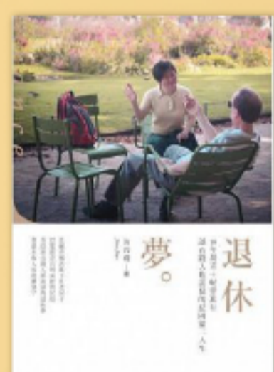
理財規劃 觀念翻轉，啟動永不嫌晚