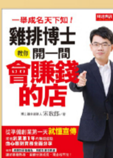
創業經營 自己當老闆，薪水放口袋