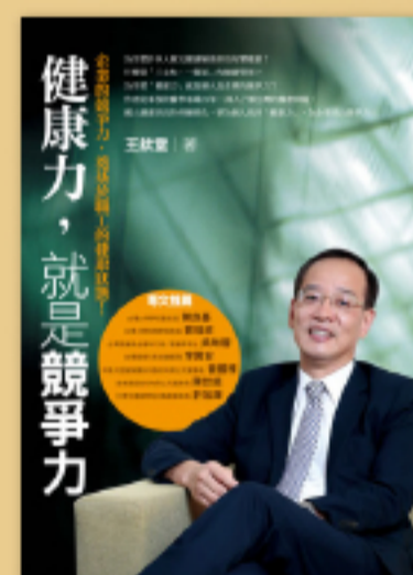
身心平衡 健康才是最大的資本